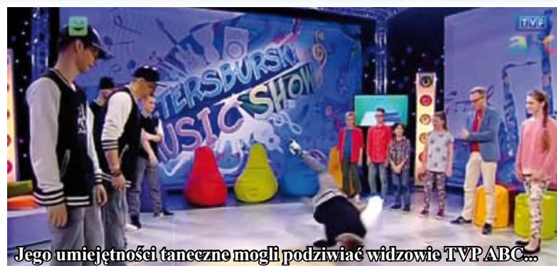
Jego umiejętności taneczne mogli podziwiać widzowie TVP ABC...