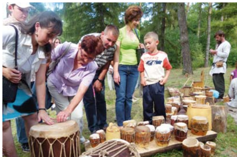
Park Kulturowy ożywa we wrześniu dzięki organizowanemu tu festynowi archeologicznemu