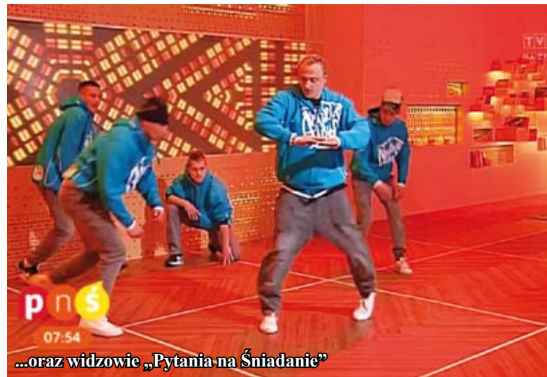
...oraz widzowie „Pytania na Śniadanie”