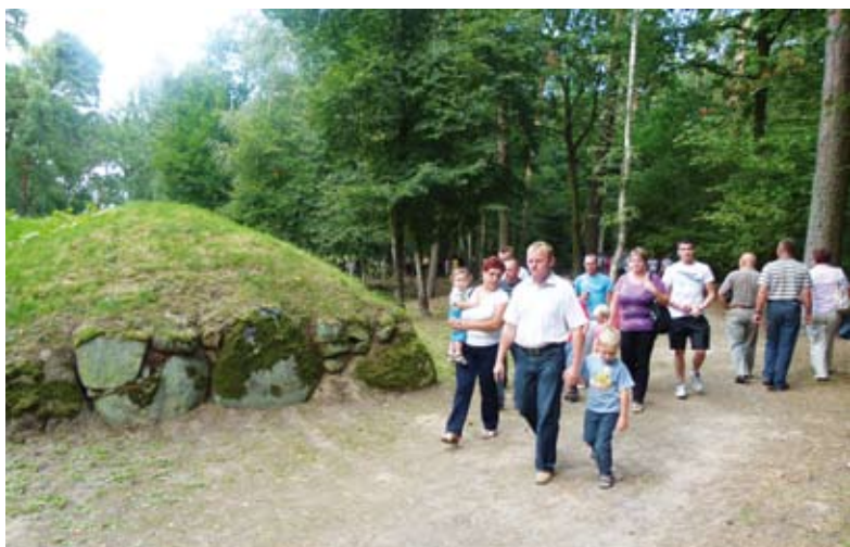
Grobowce megalityczne w Wietrzychowicach zyskują coraz większą popularność

Dla gminy borykającej się z problemem wysokiego bezrobocia każde miejsce pracy jest ważne, stąd pomysł na projekt „Odkrywcy”.